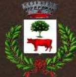
Comune di Muravera