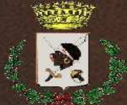
Comune di Villaputzu