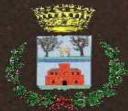
Comune di Castiadas