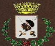
Comune di Villaputzu