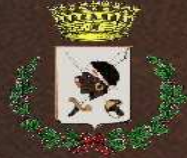
Comune di Villaputzu