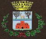
Comune di Castiadas