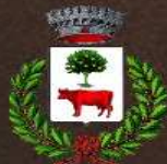
Comune di Muravera