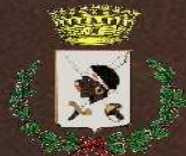
Comune di Villaputzu