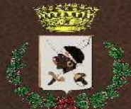
Comune di Villaputzu