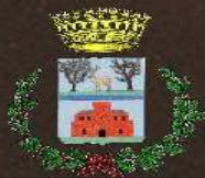
Comune di Castiadas