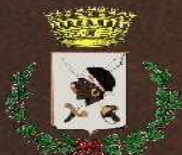
Comune di Villaputzu