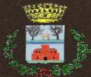
Comune di Castiadas