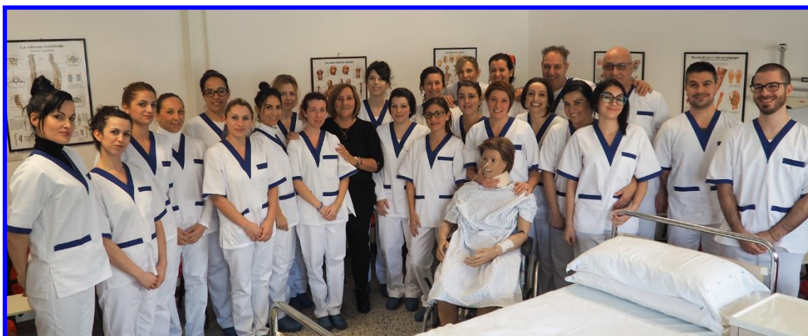
Figura professionale: l'Operatore Socio Sanitario è l'operatore che, a seguito dell'attestato di qualifica conseguito al termine di specifica formazione professionale, svolge attività indirizzata a soddisfare i bisogni primari della persona, nell'ambito delle proprie aree di competenza, in un contesto sia sociale che sanitario; favorisce il benessere e l'autonomia dell'utente.

Autorizzato dalla Regione Autonoma della Sardegna