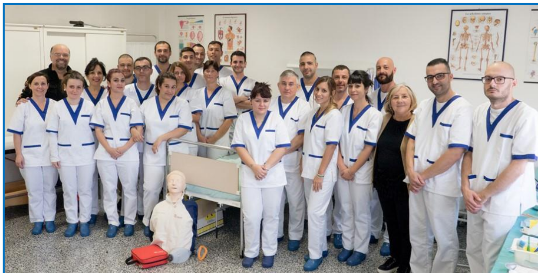
Figura professionale: l'Operatore Socio Sanitario è l'operatore che, a seguito dell'attestato di qualifica conseguito al termine di specifica formazione professionale, svolge attività indirizzata a soddisfare i bisogni primari della persona, nell'ambito delle proprie aree di competenza, in un contesto sia sociale che sanitario; favorisce il benessere e l'autonomia dell'utente.

Autorizzato dalla Regione Autonoma della Sardegna