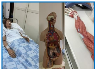
Figura professionale: l'Operatore Socio Sanitario è l'operatore che, a seguito dell'attestato di qualifica conseguito al termine di specifica formazione professionale e conseguente esame, svolge attività indirizzata a soddisfare i bisogni primari della persona, nell'ambito delle proprie aree di competenza, in un contesto sia sociale che sanitario; favorisce il benessere e l'autonomia dell'utente.

Autorizzato dalla Regione Autonoma della Sardegna