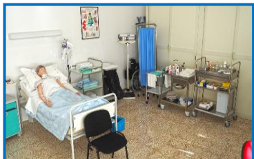
Figura professionale: l'Operatore Socio Sanitario è l'operatore che, a seguito dell'attestato di qualifica conseguito al termine di specifica formazione professionale, svolge attività indirizzata a soddisfare i bisogni primari della persona, nell'ambito delle proprie aree di competenza, in un contesto sia sociale che sanitario; favorisce il benessere e l'autonomia dell'utente.

Autorizzato dalla Regione Autonoma della Sardegna