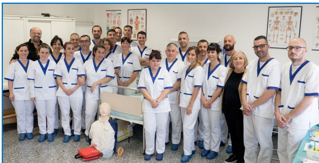
Figura professionale: l'Operatore Socio Sanitario è l'operatore che, a seguito dell'attestato di qualifica conseguito al termine di specifica formazione professionale, svolge attività indirizzata a soddisfare i bisogni primari della persona, nell'ambito delle proprie aree di competenza, in un contesto sia sociale che sanitario; favorisce il benessere e l'autonomia dell'utente.

Autorizzato dalla Regione Autonoma della Sardegna